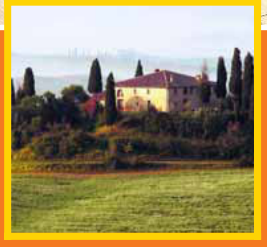
In Italië, onder meer in de populaire streek Toscane, beseffen steeds meer verkopers dat ze niet meer de hoofdprijs kunnen vragen.

riël recht aan de Vrije Universiteit leek een carrière als notaris voor de hand te liggen. „Tijdens en na mijn studie hielp ik een aantal families met vermogensbeheer. Uiteindelijk heb ik daar mijn werk van gemaakt. Een baan die ik niet per se vanuit Nederland hoefde uit te voeren, maar me de vrijheid gaf te reizen. Dus toen ik eenmaal genoeg verdiende, ging ik op zoek naar een appartement aan de Middellandse Zee.” Die zoektocht bracht hem naar Portugal, Griekenland en Italië. Totdat hij rond kerst 1986 samen met een vriend in het Zuid-Spaanse vissersdorpje Estepona belandde. „Ik werd verliefd op deze plek en nam een Nederlandse makelaar in de arm. Een projectontwikkelaar nam me mee naar een stuk grond aan de kust waar hij appartementen ging bouwen. Ik weet nog dat ik daar op het gras stond, uitkijkend over de Middellandse Zee, met in de verte Gibraltar en Afrika. Ik dacht: als ik hier ongelukkig word, dan word ik het overal. Dus kocht ik het op tekening. Op gevoel, eigenlijk.”