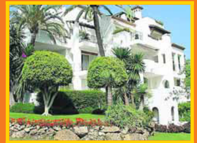
Een prachtig penthouse in het mondaine Marbella stond een paar jaar geleden nog te koop voor € 755.000. Inmiddels is de prijs gezakt naar € 525.000.