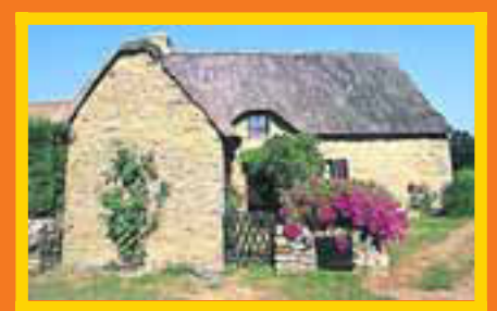
Kopen via particulieren, een goede optie voor het kopen van een huis in Frankrijk.